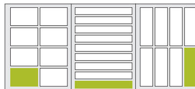
1/8 Seite 2 quer 1/8 Seite 4 quer 1/8 Seite hoch 105 × 72 mm 215 × 33,5 mm 50 × 149 mm