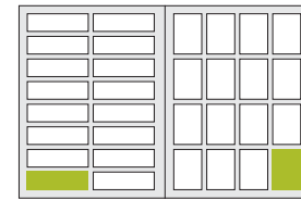
1/16 Seite quer 1/16 Seite hoch 105 × 33,5 mm 50 × 72 mm

(Seite = page, hoch = vertical, quer = horizontal)