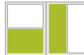
1/2 Seite quer 1/2 Seite hoch 215 × 149 mm 105 × 303 mm