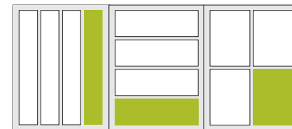
1/4 Seite hoch 1/4 Seite quer 1/4 Seite 2-spaltig 50 × 303 mm 215 × 72 mm 105 × 149 mm