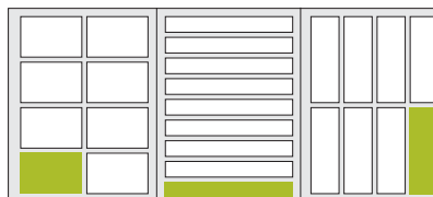
1/8 Seite 2 quer 1/8 Seite 4 quer 1/8 Seite hoch 105 × 72 mm 215 × 33,5 mm 50 × 149 mm