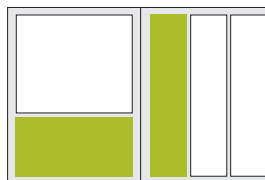
1/3 Seite quer 1/3 Seite hoch 215 × 98 mm 70 × 303 mm